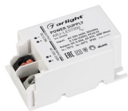
ARJ-LE57350 ARJ-LE71350 ARJ-LE40500