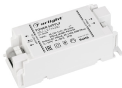
ARJ-LE86350 ARJ-LE100350 ARJ-LE114350